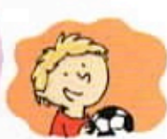
l'adolescence l'âge adulte l'enfance