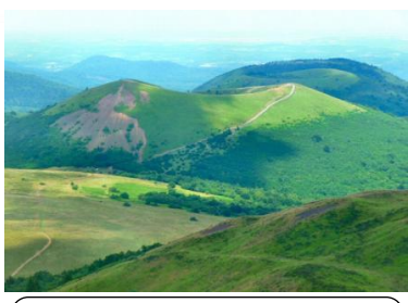
Le Massif Central